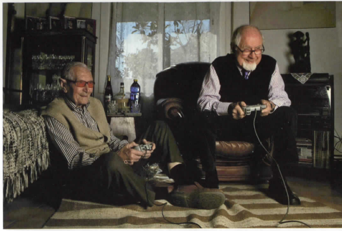
Abuelos jugones, 2008 © ANTONIO ESPEJO

Centro Cultural Las Claras Santa Clara, 1. 30008 Murcia